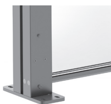
Standardfot Höger / Vänster